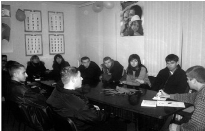
Абмеркаванне вынікаў працы Дружыны.

Сёлета спаўняецца пяць год з часу ўступлення ў сілу закона Рэспублікі Беларусь “Аб удзеле грамадзян у ахове правапарадку”. З гэтага моманту пачаўся новы этап развіцця грамадскай аховы парадку, удзелу ўсіх катэгорый грамадзян краіны, асабліва моладзі, у справе забеспячэння ўласнай бяспекі і дапамогі тым, хто гэтай справай