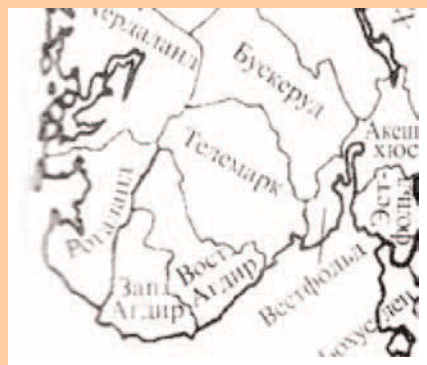
Мапа Норвегіі (частка).

Адной з пахаваных жанчын было крыху больш за 50 гадоў і, хутчэй за ўсё, яна памерла ад раку. У гістарычнай літаратуры распаўсюджана меркаванне, што, гэтая жанчына з'яўляецца каралевай Осай, згаданай у «Коле зямным» Сноры Стурлусана. На карысць дадзенай здагадкі можа паслужыць тая акалічнасць, што, як вызначыў па колькасці стронцыю ў костках нарвежскі даследчык Пэр Холк, абедзве жанчыны пражылі большую частку жыцця ў Агдыры, дзе ўласна нарадзілася і жыла каралева Оса [28].