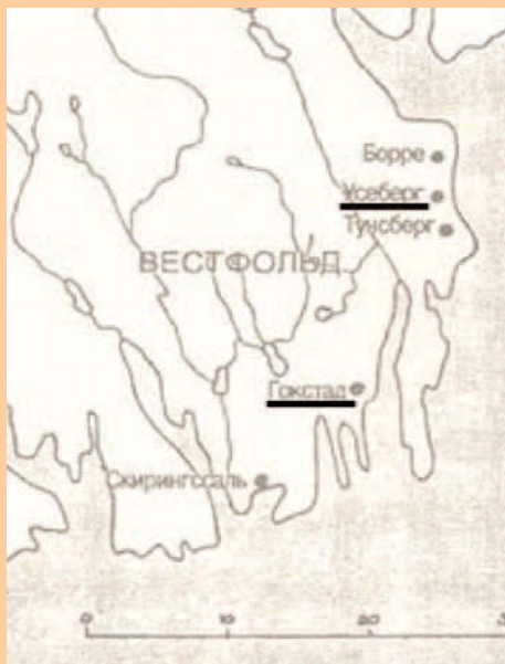
Вестфольд і наваколле Ослофіёрда (частка)

Таксама нам вядома, што Хальфдан Чорны (сын Осы і Гудрэда Паляўнічага) нарадзіўся ў 810 годзе, а прыкладна ў 828 годзе ён стаў конунгам Агдыра і падзяліў з першым сынам Гудрада Паляўнічага Олавам Гейрстад-Альвам Вестфольд: «Калі Хальвдан конунг, ягоны брат, стаў правіць разам з ім, яны падзялілі Вестфольд паміж сабой. Олаву дасталася яго заходняя частка, а Хальвдану - унутраная». (Кола Зямное, сага аб Інглінгах). «Яму [Хальфдану Чорнаму] было васьмнаццаць гадоў, калі ён пачаў кіраваць у Агдыры. Ён адразу ж адправіўся ў Вестфольд і падзяліў валоданні са сваім братам Олавам» [14. Кола Зямное, Сага пра Хальфдана Чорнага]. Мяркуецца, што шкілет, знойдзены ў Гаксадскім судне, належыць Олафу Гейрстад-Альву, паколькі даследаванне астанкаў выявіла параженне костак ног артрытам. А вось што мы можам прачытаць у «Коле Зямным» у Сазе аб Інглінгах: «У яго [Олава Гейрстад-Альва] захварэла нага, і ад гэтага ён памёр» [14]. Асебергскае ж судна пахавана менавіта ў частцы Вествольда Хальфдана, а Гаксад знаходзіцца ў частцы Вестфальда Олава. Гэтак жа мы можам звярнуцца да этымалогіі тапоніма Асеберг: у ім прысутнічае імя Осы, што, магчыма зусім не выпадкова