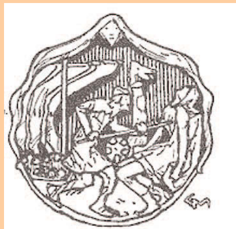
Халоп па загадзе Осы забівае Гудрода Паляўнічага.. Gerhard Munthe. Heimskringla. 1899

Агдыры. Адразу ж пасля гэтай падзеі Хальфдан накіраваўся ў Вестфольд і падзяліў яго са сваім братам Олавам (сын Гудрода ад першага шлюбу з Альфхільд) [14].