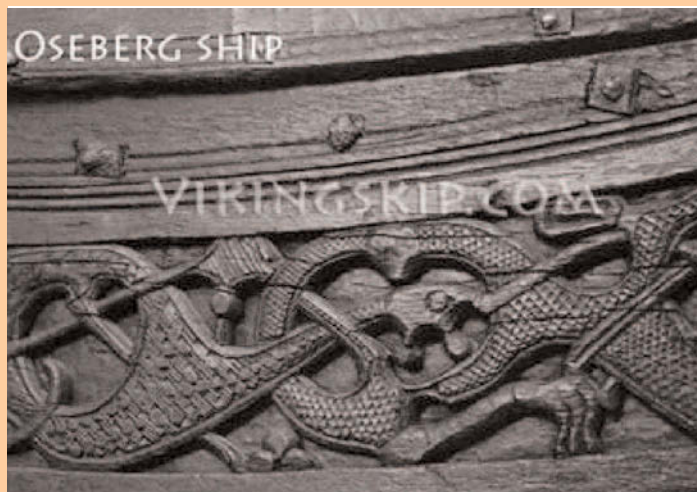
Разьба на штэўнях Асебергскага судна [19]

На штэўнях Асебергскага судна знойдзены выдатны разьбяны арнамент Там намаляваныя пераплеценныя расліны, жывёлы і людзі. Нічога падобнага на іншых караблях не сустракалася. Магчыма, гэты арнамент меў сакральны характар і нёс рэлігійнуюсэнсавую нагрузку.