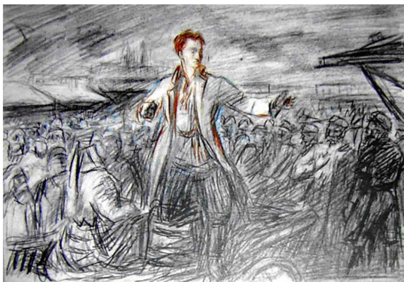
Эскіз мастака М. Філіповіча да карціны «Кастусь Каліноўскі» (1930-я гг.)

У сугучнасці з пісьмовай версіяй «партрэта» нам падаецца натуральным суправадзіць яго версіяй мастацкай — эскізам постаці Кастуся Каліноўскага беларускага жывапісца Міхася Мацвеевіча Філіповіча (1896—1947). Гэты мастак адным з першых у савецкай Беларусі звярнуўся да нацыянальнай тэматыкі.